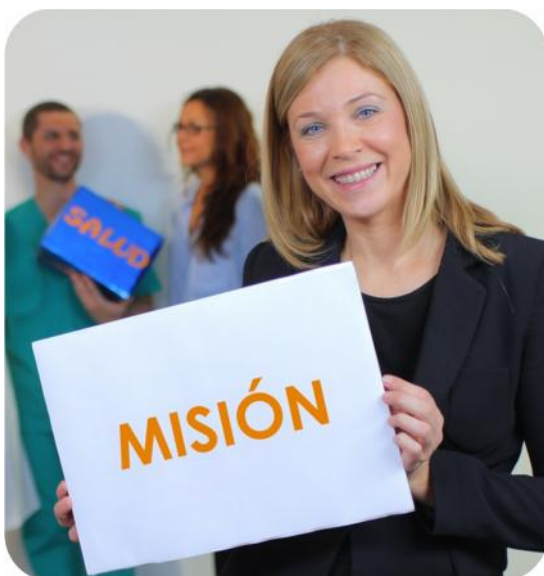
Trabajadores de umivale

“Optimizar la salud de nuestros mutualistas, mediante una prevención eficaz o curando bien y rápido , cuando el daño no se ha podido evitar, y gestionar el resto de prestaciones asignadas por Ley, indemnizando cuando proceda.”