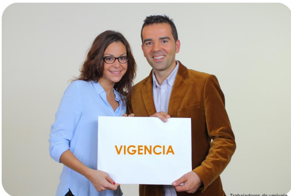
Trabajadores de umivale

El presente Código Ético entrará en vigor desde el día 29 de enero de 2021 y hasta que se apruebe una nueva actualización o se proceda a su derogación.