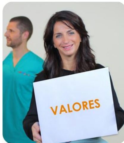
Trabajadores de umivale

umivale confía en la capacidad de juicio ético e integridad personal de sus Miembros y estas pautas de conducta hay que entenderlas como guías y normas para tomar decisiones responsables en situaciones laborales y profesionales, que deben estar presididas por los siguientes cuatro valores éticos :