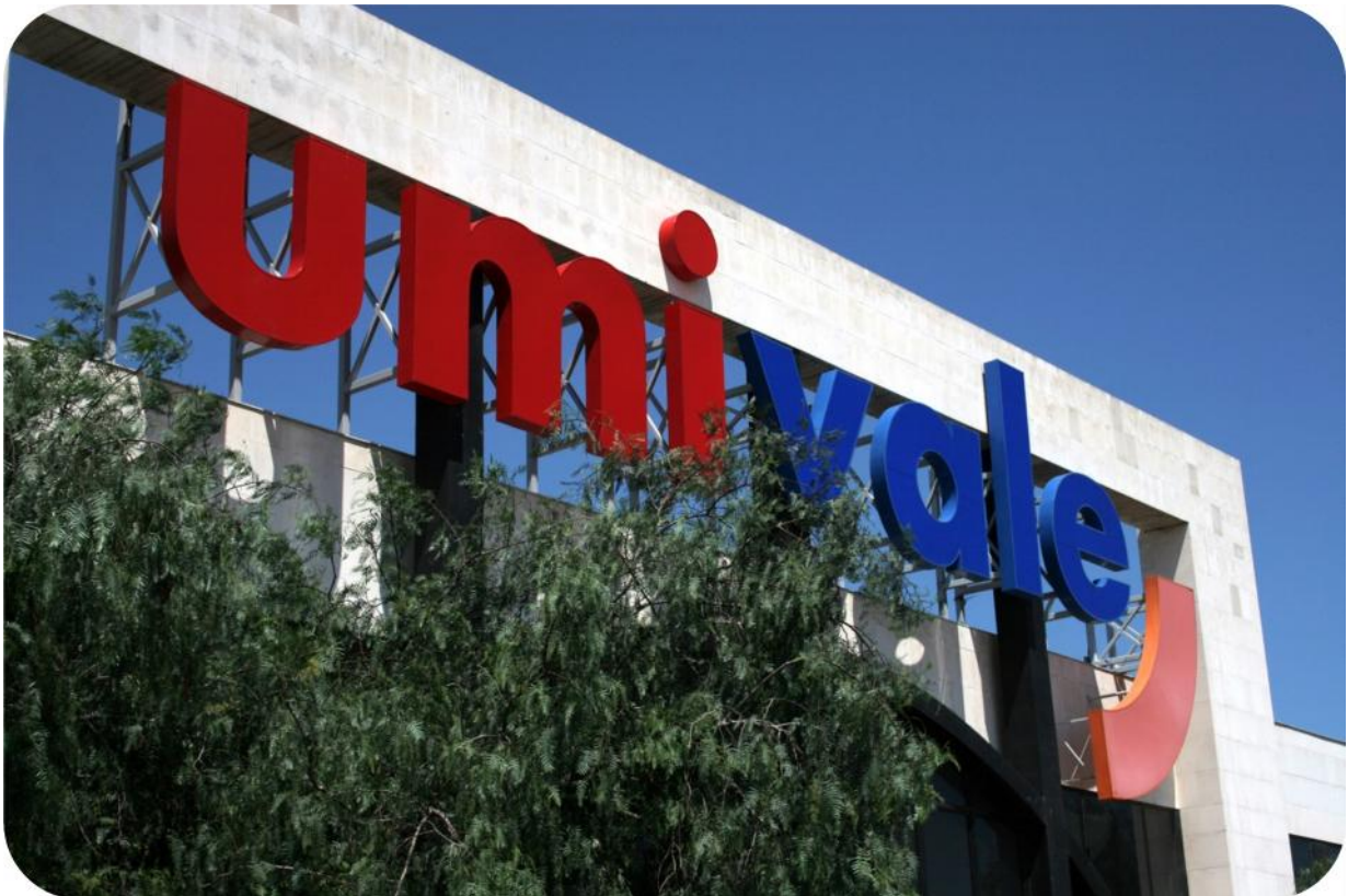
Sede umivale – Quart de Poblet

La Junta Directiva , con la voluntad por una parte de profundizar en la gestión ética de umivale , tanto en sus relaciones internas como externas, y por otra parte de estar por encima de los objetivos económicos o profesionales que coyunturalmente puedan ser marcados en cada periodo, aprobó en su reunión del 31 de octubre de 2014 el presente Código Ético , revisado el 29 de mayo de 2019.