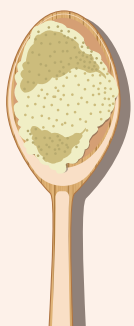
Ceba en pols