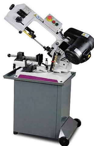
Serra de cinta indústria alimentària (tall de carn, ossos, peix...)