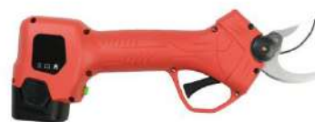
Tisores de poda elèctriques