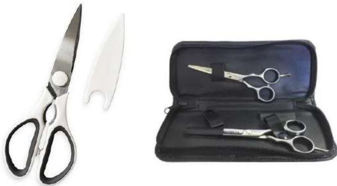
Exemple: protector i estoig per a tisores