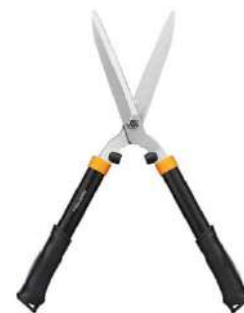
Tisores de poda manual