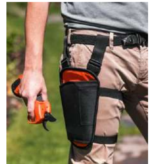
Exemple: funda tisores de poda