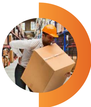
Cuidado de la Espalda