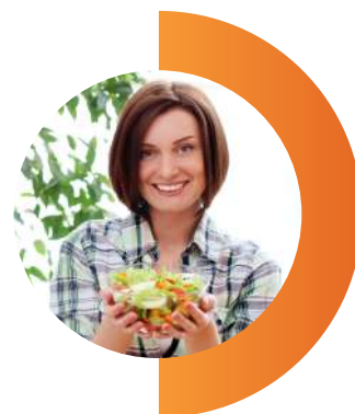
Nutrición y Alimentación Saludable