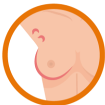
Nòdul palpable a l'aixel·la