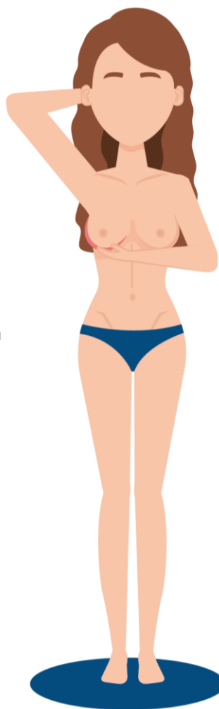
Dolor a la mama a la palpació