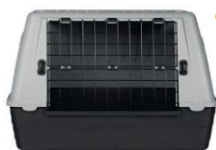
Cistella de transport