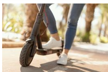
VEHÍCULOS DE MOVILIDAD PERSONAL-PATINETES