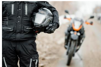
TÉCNICAS CONDUCCIÓN SEGURA DE MOTOCICLETAS