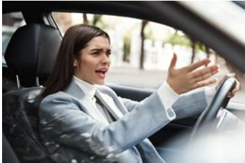
ESTRÉS Y CONDUCCIÓN