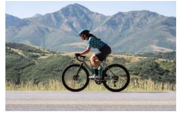
PREVENCIÓN ATROPELLO A CICLISTAS