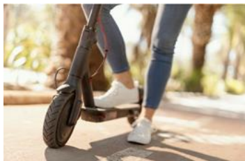
VEHICLES DE MOBILITAT PERSONAL - PATINETS