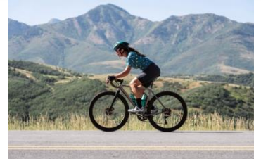
PREVENCIÓ ATROPELLAMENT A CICLISTES