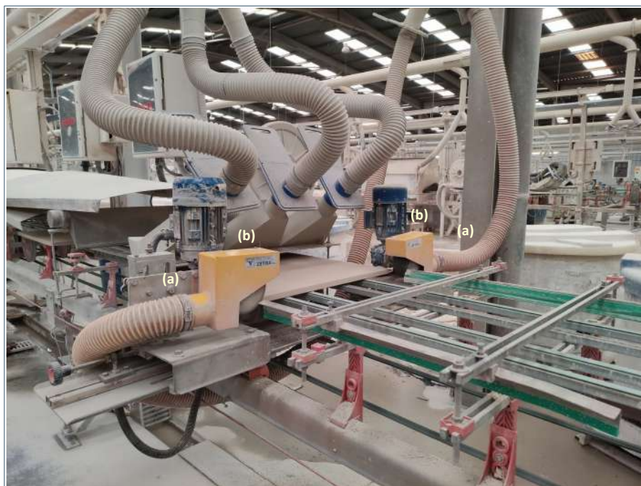
Línea de esmaltado: (a) tomas de aspiración y (b) encapsulamientos, en los rascadores de piezas cerámicas [Unimat Prevención]

Para garantizar que se mantiene la eficacia de estos sistemas, deberán implementarse programas de mantenimiento preventivo que tengan en cuenta las recomendaciones del fabricante, proveedor o instalador, verificándose que el cambio de consumibles (como filtros) se realiza conforme a las instrucciones del fabricante. Especial atención debería prestarse al acople de las bocas de aspiración localizada (flexibles) con los encapsulamientos.