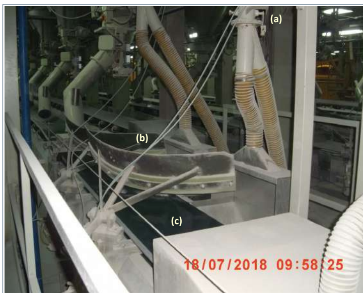
Cintas de transporte: (a) tomas de aspiración; (b) centradores; (c) encapsulamientos [Unimat Prevención]