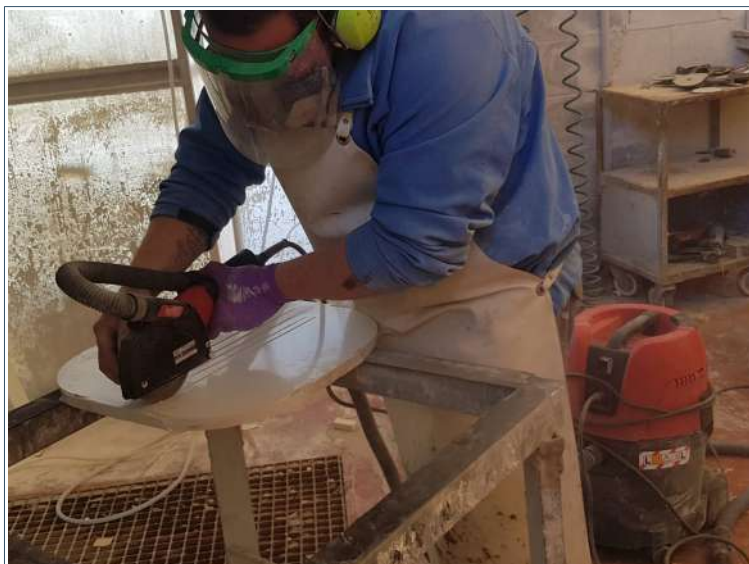
Sistema de extracción portátil [INVASSAT]