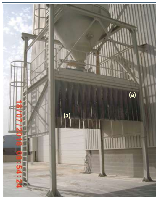
Cortinas (a) [Unimat Prevención]