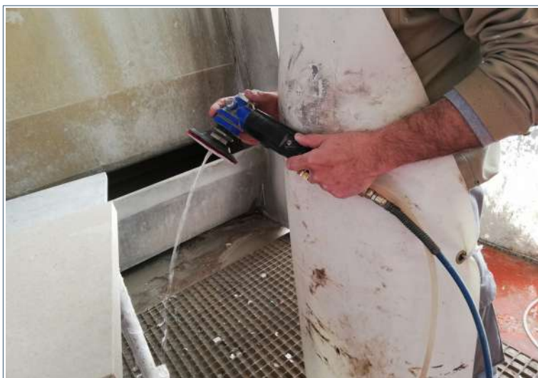
Pulidora portátil: aporte agua [INVASSAT]

Emplear sistemas de corte o pulido a baja velocidad.