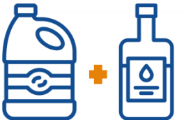
LEJIA + VINAGRE

El vinagre tiene un ácido que cuando se mezcla con la lejía genera un gas tóxico llamado gas cloro , que puede provocar quemaduras graves en los ojos y en las vías respiratorias .