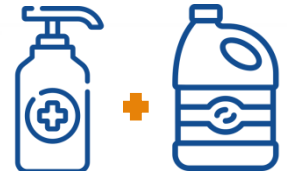
ALCOHOL GEL + LEJIA

Su mezcla produce cloroforno y ácido clorhídrico , ambos muy tóxicos. Inhalar sus vapores puede producir daños en ojos, piel, pulmones, riñones, hígado y sistema nervioso .