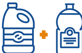
LEJIA + LAVAVAJILLAS

La mezcla de lejía con limpiacristales, limpiadores WC o lavavajillas produce gas cloro . La mínima exposición a este gas causa problemas respiratorios y oculares, entre otros .