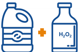
LEJIA + AGUA OXIGENADA

Al mezclarlos forman cloratos o percloratos , que se utilizan en explosivos. Los cloratos por una reacción exotérmica, que genere calor, podrían provocar una explosión .