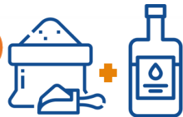
BICARBONATO + VINAGRE

El vinagre es ácido y el bicarbonato, alcalino, por lo que al unirlos se neutralizan. Esta combinación puede causar una explosión si los mezclas en un recipiente cerrado .