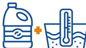
LEJIA + AGUA CALIENTE

Si se diluye lejía en agua caliente, se evapora el cloro y ya no desinfecta, generándose emanaciones que pueden causar intoxicación e irritación de las mucosas .