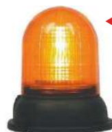
Senyal lluminós V-2