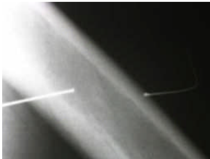
Imagen de la rx practicada, al lado y más tenue se observa un alambre que nos servirá de guía para aproximar la localización.